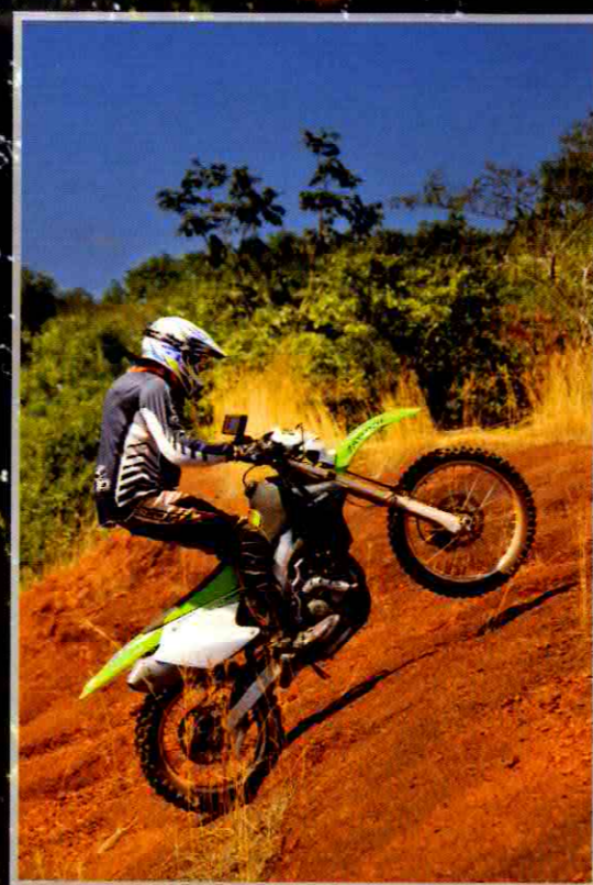
Si la relaxation, le franchissement ou le contact avec la faune ne sont pas nécessairement au menu quotidien, ils agrémentent énormément ce raid africain lorsque l'occasion se présente.

les chutes. Les passages techniques sont assez rares, mais ils demandent de la pratique pour ne pas risquer de se "vider" pour la journée.